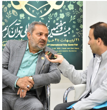
است که در نمایشگاه قرآن می توان به آنان پرداخت. معاون پرورشی وزیر آموزش و پرورش

علیرضا کاظمی معاون پرورشی و فرهنگی وزیر آموزش و پرورش با بیان اینکه مدیریت بخش دانشگاهی نمایشگاه قرآن امسال بر عهده دانشگاه فرهنگیان است، تصریح کرد: این دانشگاه حقیقتاً افتخارات بزرگی در حوزه قرآن و معارف کسب کرده است.