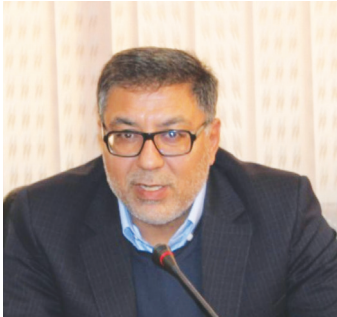
دانشجویان در نمایشگاه قرآن کریم خبر داد.