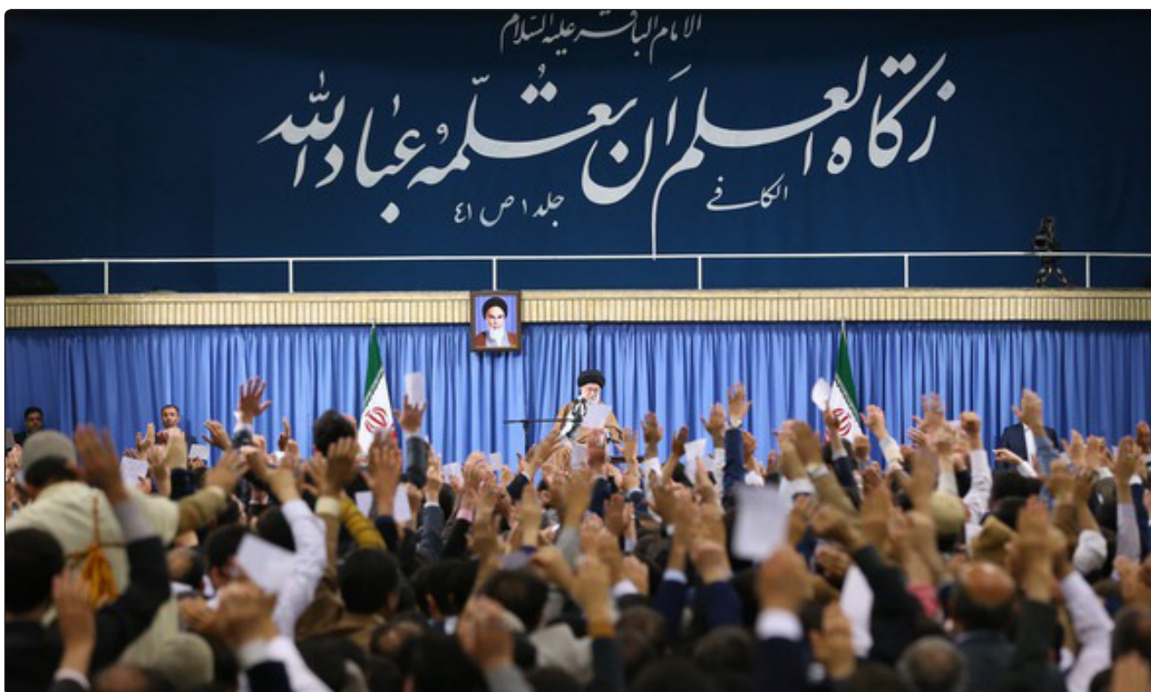
رئیس جمهور در ضیافت افطار اساتید و دانشجویان

دغدغه کیفیت ؛ بودن و ماندن بر مدار مأموریت