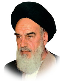
تربیت و تزکیه مقدم بر تعلیم است

نشریه دانشگاه فرهنگیان * ۸ صفحه * تیرماه ۱۳۹۶ * شوال ۱۴۳۸ * july 2017 * http://www.cfu.ac.ir