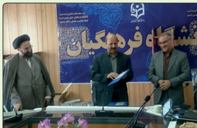
در مراسمی به همت معاونت آموزشی و

سرپرست دانشگاه فرهنگیان کشور در ادامه اظهار کرد: از روابط عمومی ها انتظار می رود بازتاب مناسبی از فعالیت های عرصه تعلیم و تربیت دریافت و آن را دستمایه ترفیع و بهبود عملکرد خود قرار دهند.