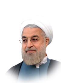
معلم مبداء دانش و مهارت جامعه است