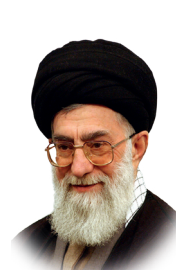
تاکید می کنیم؛ دانشگاه فرهنگیان را مسئولین جدی بگیرند