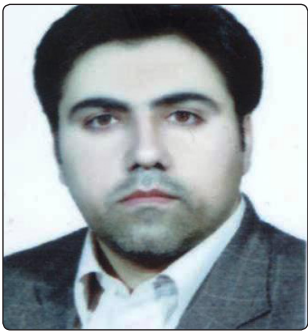
دکتر فرزاد امیری سرپرست مدیریت امور پردیس های استان کرمانشاه