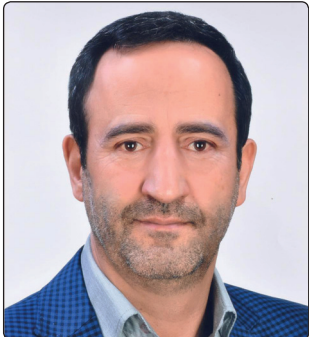
دکتر سید حسین مجتبیوی سرپرست مدیریت امور پردیس های استان خراسان رضوی